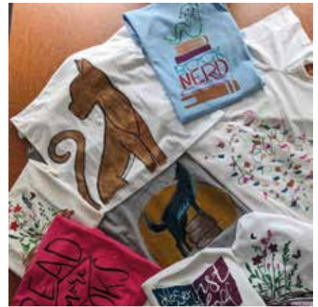
Die an Bücher und lesen angelehnten Motive kamen zum Abschluss des Buchsommers auf T-Shirts.

Ganz besonders gefreut haben wir uns über die rege Beteiligung an unserer Abschlussveranstaltung, für die wir sogar einen Wiederholungstermin ansetzen mussten: 15 Kids haben mit uns zusammen buch- und leseaffine Motive auf Textilien gedruckt, gemalt und gekleckert. Dabei wurde deutlich, dass wir in der Bibliothek nicht nur begeisterte Leseratten, sondern auch talentierte Künstlerinnen und Künstler begrüßen. Wir freuen uns schon auf den nächsten Buchsommer, 2024 in unserer Bibliothek!