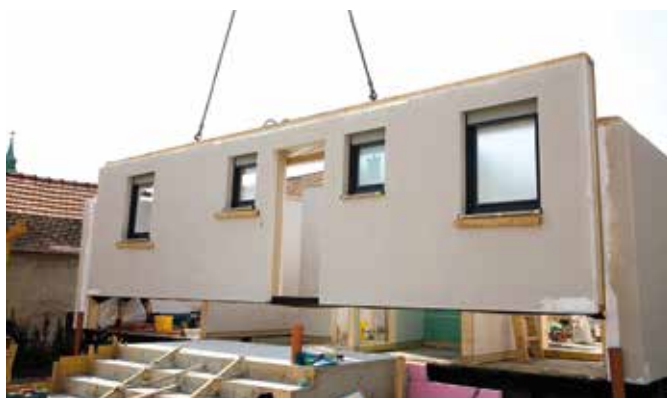
Wegen kurzer Bauzeiten und einer einfachen Budgetplanung entscheiden sich viele Bauherren für ein Fertighaus.

Egal ob Massiv- oder Fertigbau, vor der Errichtung eines Gebäudes sind einige Arbeiten am Baugrundstück unerlässlich. Dazu gehören vor allem die Bodenplatte oder der Keller sowie die Grundleitungen