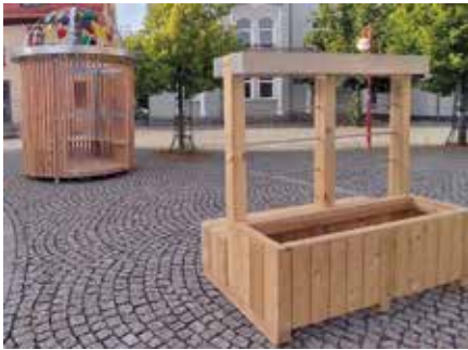
Die Voliere und eine Sitzmöglichkeit, die auf einer Seite bepflanzt werden kann, laden auf dem Markt zum Verweilen ein.

Schulcampus, eine mitten auf dem Marktplatz entstehende neue Stadtbibliothek (Haus des Wissens) und das Kulturhaus (Musikarche) an der anderen Seite der Innenstadt sollen funktional miteinander vernetzt werden. Damit sind neue Räume zu definieren und anzueignen, die