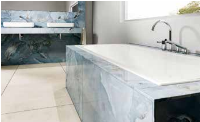
Die moderne Profilgestaltung ermöglicht das Aufgreifen des Fliesen- oder Natursteindesigns.

Mit dem Programm MyDesign by Schlüter-Systems können zahlreiche beliebte Profile an das Fliesendesign angepasst werden. So ist es möglich, einen effektiven Kantenschutz harmonisch in den Belag zu integrieren oder Akzente im Sockel- oder Wandbereich zu setzen. Auch Wunschmotive wie besondere Muster oder Logos lassen sich auf die Profile aufbringen – so können private wie gewerbliche Bauherren ihre Individualität zum Ausdruck bringen. Mehr Informationen zu dem Programm, das für jeden Geschmack die gewünschte Gestaltungsmöglichkeit hat, gibt es unter eu.schluter.com/de-DE/ . Die hochwertige Digitaldrucktechnik steht für Abschlussprofile, Bordürenprofile, Sockelprofile und die sogenannten Hohlkehlprofile des Anbieters zur Verfügung.