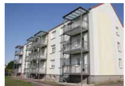
In Beucha wurden an den Wohnblock August-Bebel-Straße 56 A und B Balkone angebracht.

Die Mieter der Beuchaer Bau und Wohnungsgesellschaft mbH (BWG) in der August-Bebel-Straße 56 A und B können sich jetzt über Balkone freuen. Insgesamt wurden 12 Stück angebaut. Der Block mit ausschließlich 3-Raum-Wohnungen wurde 1958 erbaut. Nachdem bereits Außenjalousien installiert wurden, kam nun die Nachrüstung mit modernen Balkons hinzu. Dafür wurden seitens der BWG 160.000 Euro investiert.