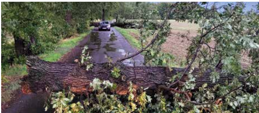
Glück im Unglück hatte die Familie, als vor und hinter ihrem Pkw Bäume umstürzten.