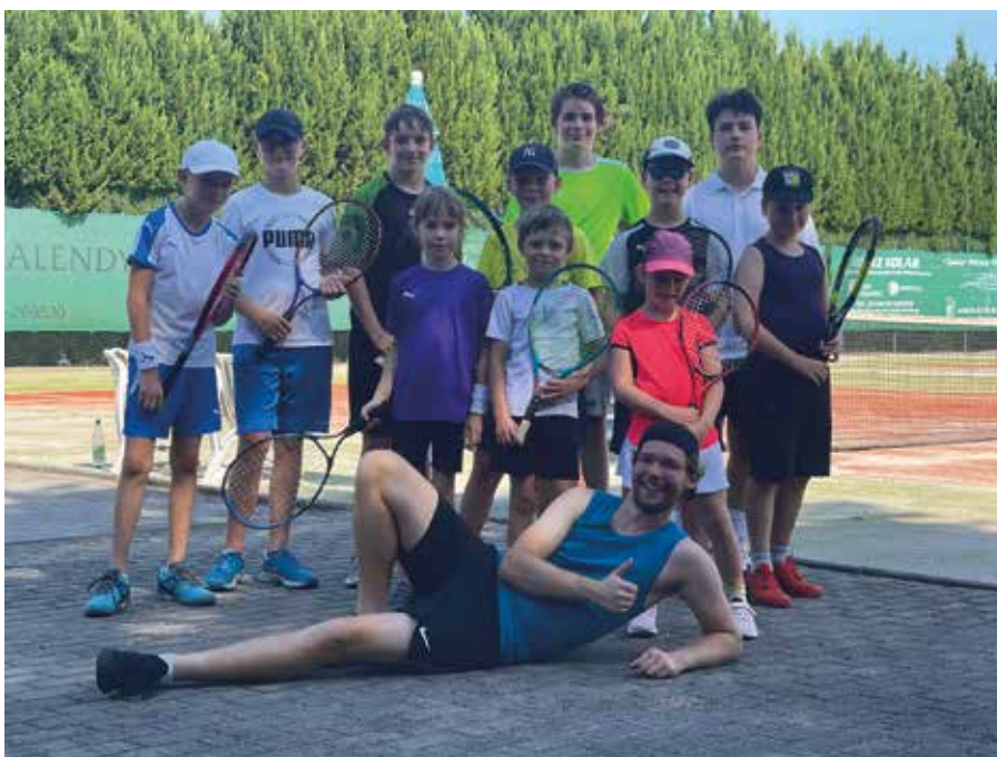
Trotz der Hitze waren die Teilnehmer der Vereinsmeisterschaften der Kinder- und Jugendlichen des Tennisclub Beucha e.V. mit ihren Ergebnissen zufrieden.

Claudia Liederwald, Tennisclub Beucha e. V.