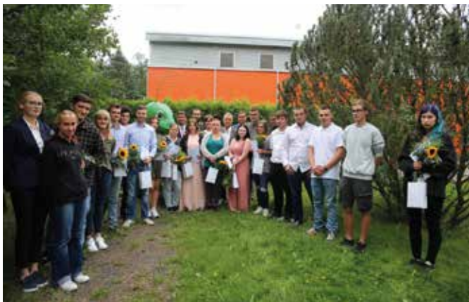
Im Anschluss an die Freisprechung trafen sich die Absolventen und Absolventinnen mit offiziellen Gästen zum Gruppenfoto im Garten.