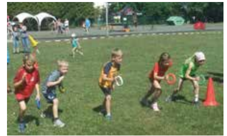
Spannung vor dem Biathlonstart

Nach der stimmungsvollen Eröffnung wurde an den verschiedenen Wettkampfstä-