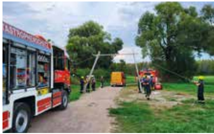
Bei der Katastrophenschutzübung in Neichen ging es um Wasserversorgungsstrecken.

In den letzten Diensten hatten wir zwei Bootsausbildungen an dem Kiessandtagebau in Kleinpösna, welche uns dankenswerter Weise die Mitteldeutsche Baustoffe GmbH ermöglichte. Dabei ging es um die Wasserrettung von Personen mit unseren Booten, das Szenario Mann über Board, das Bootsfahrtraining und sicheres Verhalten bei der Rettung.