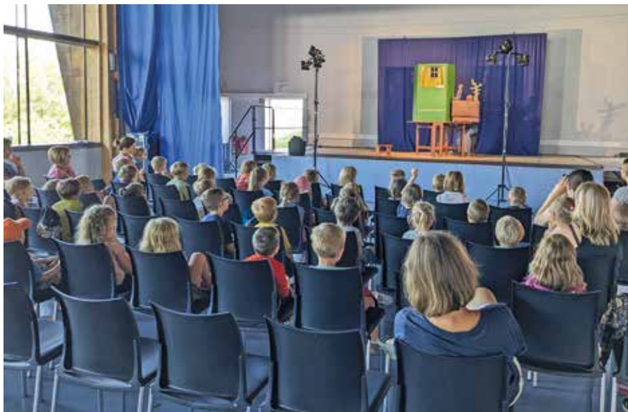
Rund 50 Kinder hatten beim Puppentheater viel Spaß.

Alle Kinder und auch ihre Erzieher fierten mit, es wurde gelacht und am Ende gab es tosenden Applaus für die tolle Dar-