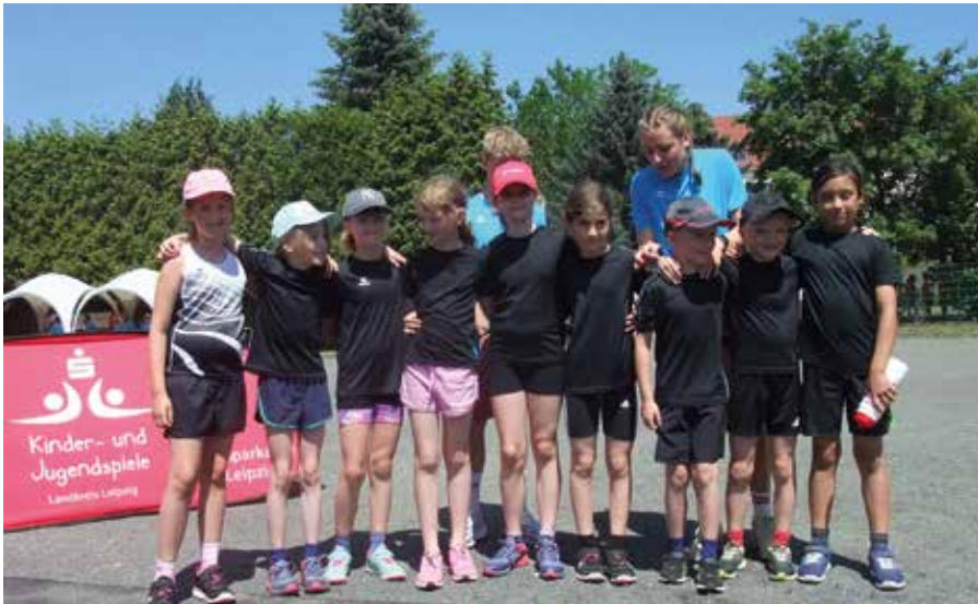
Für den ESV Lok Beucha starteten die „Schwarzen Panther“.

ESV Lok Beucha, Abteilung Leichtathletik