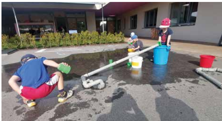
Wasserspiele im Purzelbaum.

Wir wünschen allen Kindern, Eltern und uns einen schönen Übergang in ein neues aufregendes Kindergartenjahr.