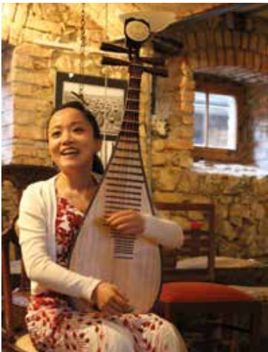
Foto von der Veranstaltung aus dem letzten Jahr

Das Hoffest erhält Unterstützung von der Lokalen Partnerschaft für Demokratie (Landkreis Leipzig).