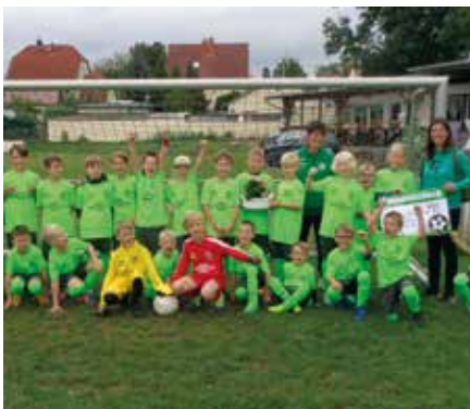
Die Spende der Mannschaft über 250 Euro kommt dem Wolfsträne e. V. zugute. Der kümmert sich um trauernde Kinder und Jugendliche.