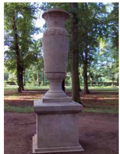
„Runderneuert“ steht die Vase wieder im Stadtpark.