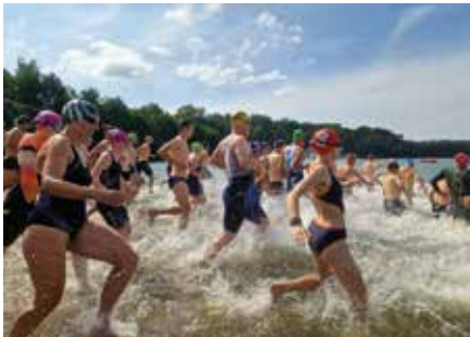
Ab in die Fluten hieß es für die Starter.

Viel Sonnenschein, gute Stimmung und der sportliche Triathlon-Flair begleiteten die knapp 700 Starter bei beiden Teamwettbewerben. So starteten sowohl beim Family-and-Friends-Triathlon als auch beim Team-Triathlon jeweils drei Sportler gemeinsam, um den Dreikampf aus Schwimmen, Radfahren und Rennen zu bewältigen und schließlich gemeinsam die Ziellinie zu überqueren. Egal, ob Groß oder Klein, Alt oder Jung, Triathlon-Neuling oder Triathlon-Profi, jeder hat sein Bestes